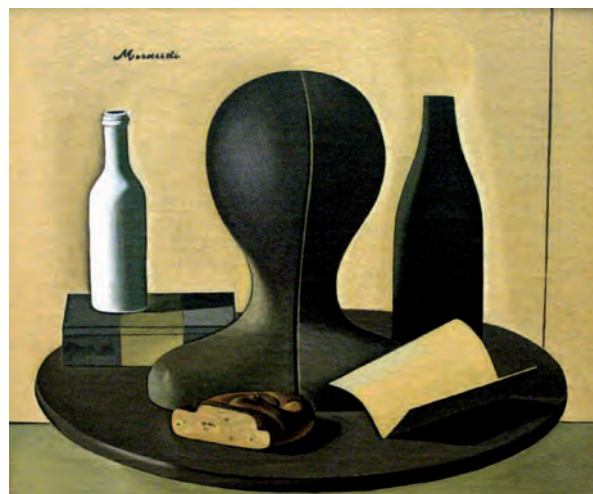
In questa pagina a sinistra Jean-Michel Folon Le Secret a destra: Giorgio Morandi Natura morta con manichino

È nato il 6 dicembre scorso, dopo un innovativo recupero del centralissimo Arengario, il nuovo Museo del Novecento, tesoro prezioso che arricchisce la proposta culturale di Milano. Questa importante apertura riconsegna, infatti, alla città una delle maggiori e più ricche collezioni d'arte, con capolavori celebri ed unici, rappresentativi della storia e dell'arte del secolo scorso. Il '900 artistico sarà quindi il protagonista dell'incontro, presentato ed esaminato, con l'analisi e il commento, la storia e la lettura, delle opere più significative che compongono la raccolta milanese. Un suggerimento